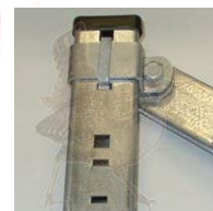
Klammer groß mit Schelle