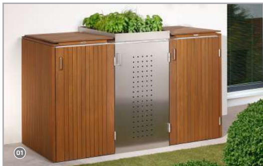
01 Hartholz FSC®-Kombination!

Dezent und in schönem Design können sich unsere Mülltonnenboxen Binto vor jedem Haus sehen lassen. Auf ihren Deckeln bieten sie noch Platz für „Extragrün“ im Eingangsbereich. Die Verkleidung der Boxen ist variabel möglich. Edelstahl, Hartholz FSC®, Fichte massiv oder Hochdruckschichtstoffplatten erlauben die unterschiedlichsten Kombinationen in der individuell bevorzugten Optik.