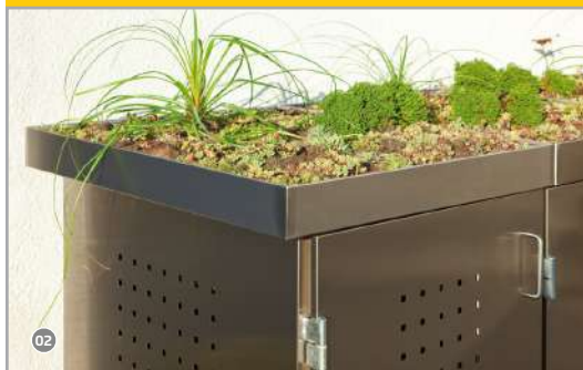
02 Müllbox mit Edelstahl-Deckel!

Das Grundgerüst aus verzinktem Stahl ist bei allen Design-Varianten gleich. Das Boxensystem besteht immer aus mindestens einem Grundgerüst und einer Grundverkleidung, die mit einem Erweiterungsgerüst und der dazugehörigen Erweiterungsverkleidung vergrößert werden kann. Zum Öffnen der Box gibt es eine oder mehrere Türen an der Vorderseite. Die Box ist mit einem festen Deckel aus Edelstahl, als Pflanzschale oder mit einer Kippfunktion ausgestattet, die es erlaubt den Abfall auch von oben in die Box einzufüllen.