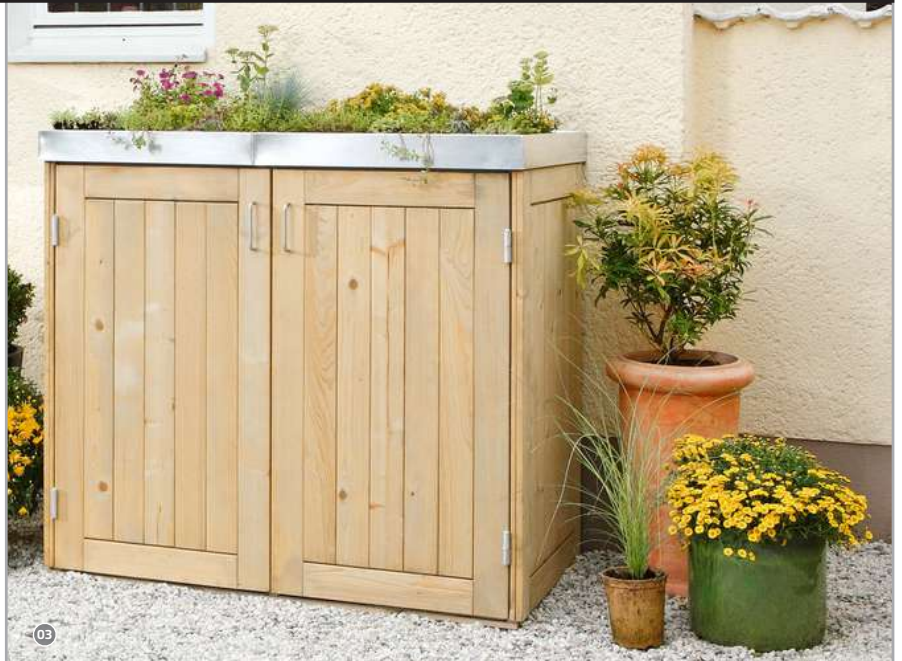
03 Natürliche Nadelholz Elemente!