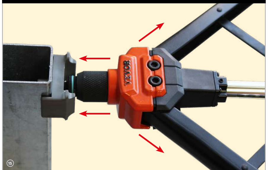
15 Die Zange komplett aufspannen, in Niete stecken und zudrücken!