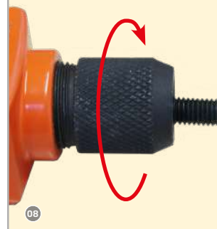
08 Halterung aufsetzen!