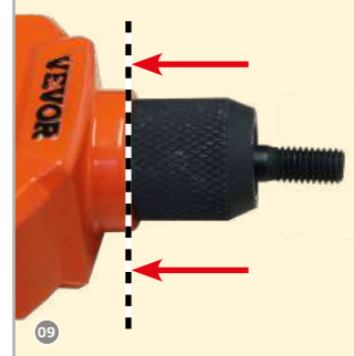
09 Bis Anschlag festdrehen!