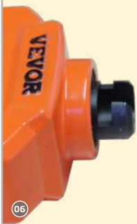
06 Zange ohne Aufsatz!