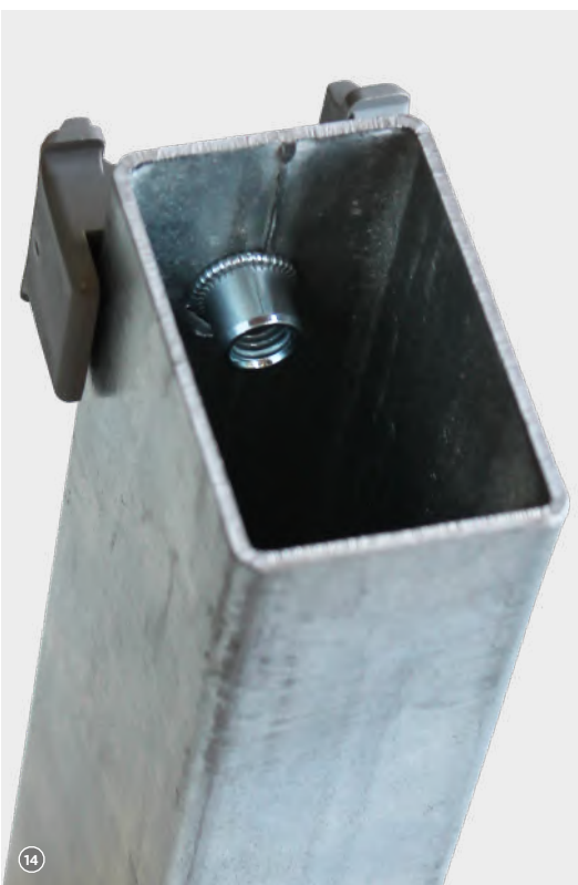
14 Fertig montierte Niete im Pfosten Inneren!

Das Werkzeugset erfordert keine komplizierten Handgriffe. Durch Tauschen der entsprechenden Nietdorne und Nietmutter ist die Zange für verschiedene Einsätze griffbereit. Durch Öffnen und Schließen des Griffs wird die Mutter montiert und gelöst. Nach der Installation werden die Griffe gespreizt und zwei- bis dreimal zusammengedrückt, um den Dorn von der Mutter zu entfernen.