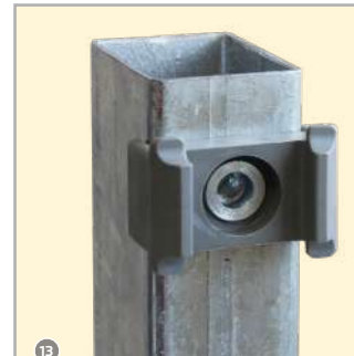
13 Niete im Pfosten!