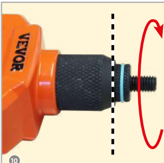
10 M8 Konter fest eindrehen!