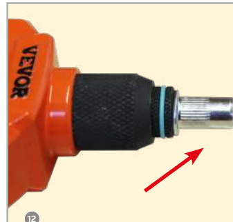
12 M8 Niete aufgesetzt!